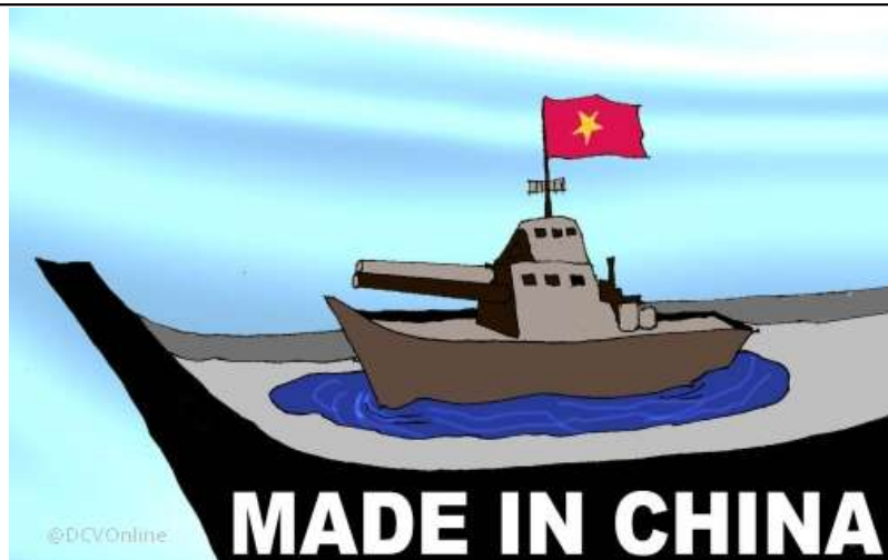
Chủ quyền Biển Đông (Babui - DCVOnline)